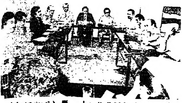
اجتماع مجلس ادارة الصناعيين امس

المرشد المحدث في الساعة الثانية من بعد ظهر اليوم في قاعة تجارة وصناعة بيروت لانتخاب نصف اعضاء مجلس ادارة جمعية الصناعيين ، لم يبلغ ، كما ان التطورات لم تؤكد امكانية تأمين النصاب .